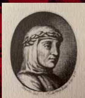
Portrait de Pétrarque (Noël Le Mire)